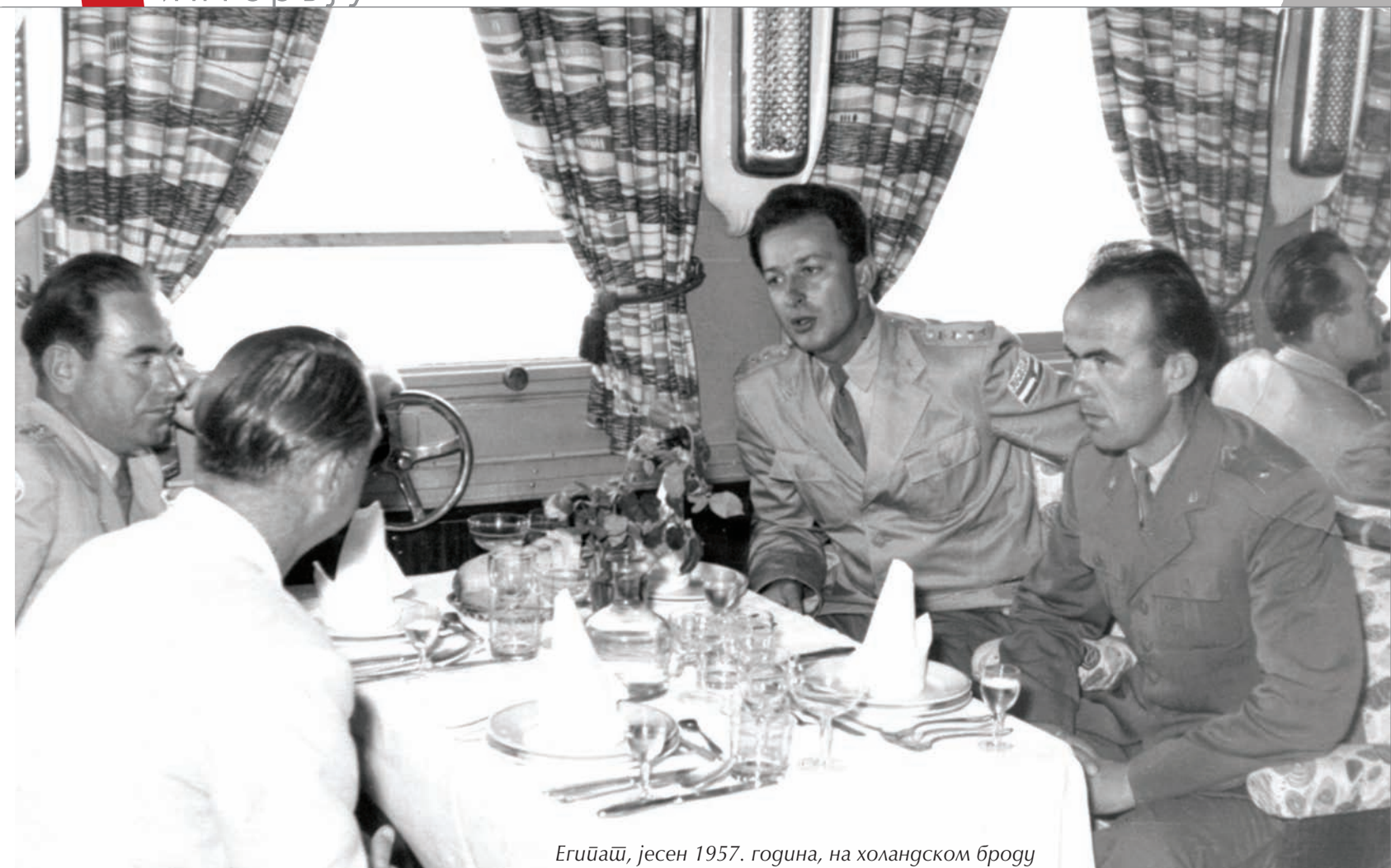
Егиџаџи, јесен 1957. година, на холандском броду

Добио је надимак „Јова Србин“. Кад је почео да ради у „Народној армији“ највише људи било је из Црне Горе, Хрватске и Словеније. Најмање је било Срба.